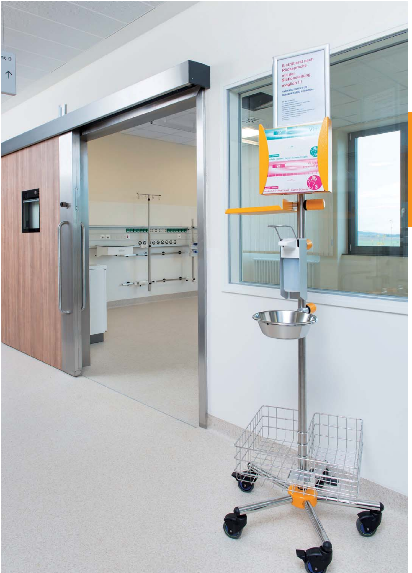
Infusionsständer und Mobilar