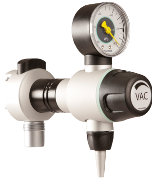
Bsp.: Skua 2.0 -90 Schienengerät AIR