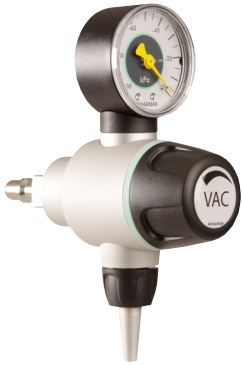
Bsp.: Pirol 2.0 -90 Steckergerät VAC