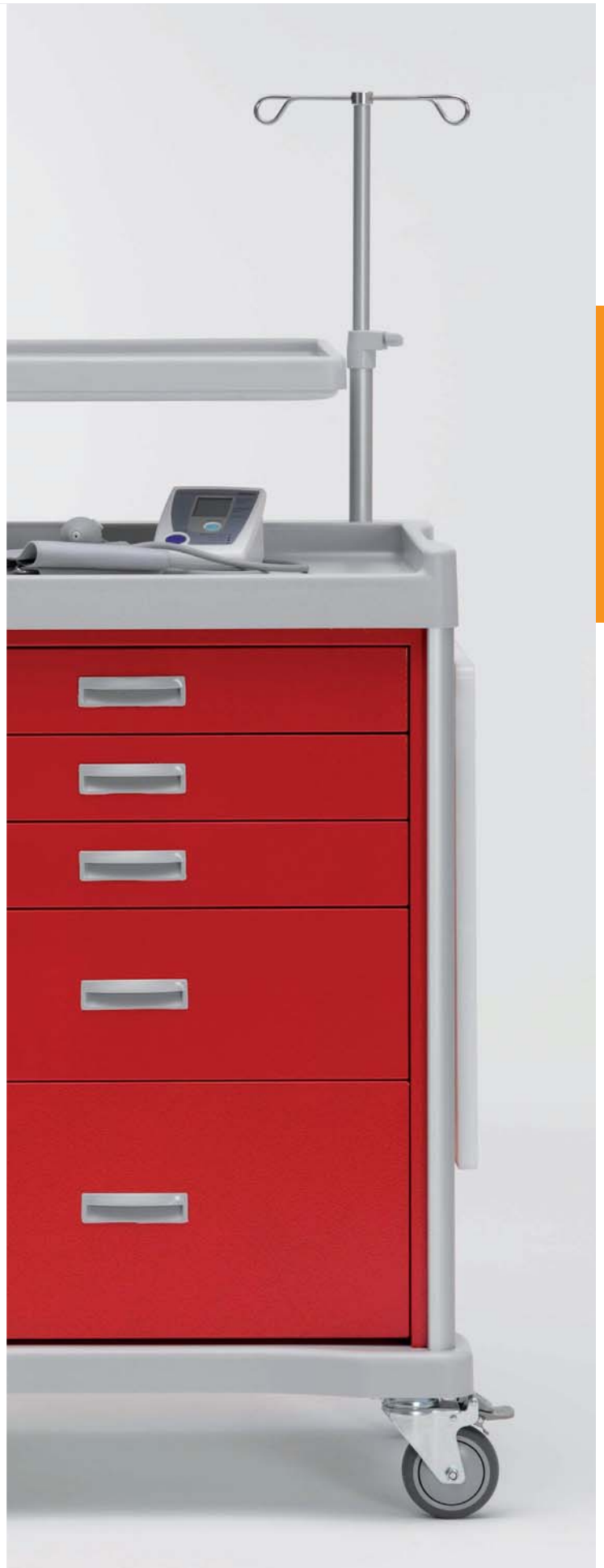
Infusionsständer und Mobilar